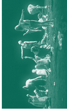
Si c'était de l'amour