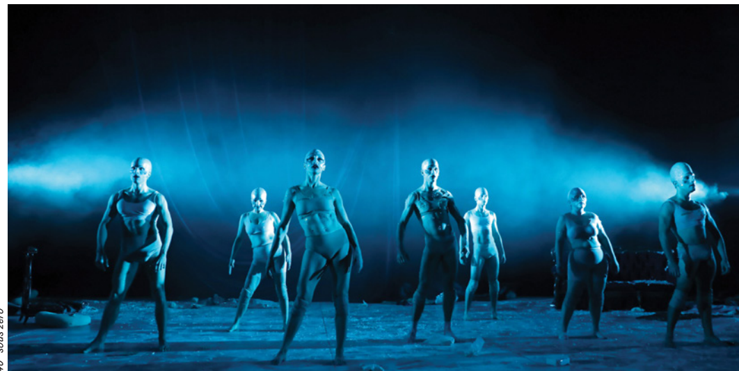
40° sous zéro

Fin mars 2023, le compositeur Ryuichi Sakamoto s'éteint. Véritable monument de l'électro et de l'ambient, musique inspirée du rock planant et des musiques répétitives américaines, ses bandes originales pour Bertolucci, Almodóvar ou De Palma sont inoubliables. Le groupe jazz Asynchrone embrasse l'œuvre prolifique du musicien dans un hommage libéré des carcans, à l'image du génie japonais.