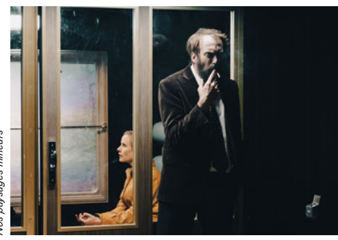
Nos paysages mineurs