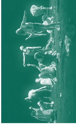
Si c'était de l'amour